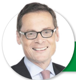
Par Roger Köppel conseiller national Küssnacht, ZH

L'accord institutionnel ne peut être rattrapé ni amélioré. Il faut le rejeter purement et simplement.