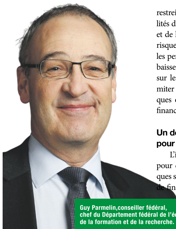
Guy Parmelin, conseiller fédéral, chef du Département fédéral de l'économie, de la formation et de la recherche.

Pour toutes ces raisons, le Conseil fédéral et le Parlement recommandent un NON le 29 novembre 2020.